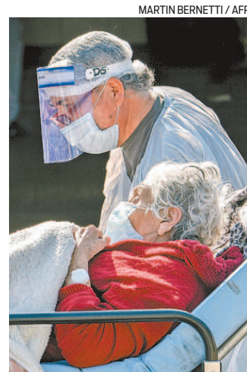
Covid: 1 milhão de casos em 6 dias

O ritmo da propagação da pandemia impressiona: o mundo somou um milhão de novos casos em apenas seis dias. Para efeito de comparação, o planeta levou três meses para alcançar o primeiro milhão de infectados. Desde 21 de maio, o número de casos da doença dobrou. Os Estados Unidos são o país com maior quantidade de infectados e de óbitos. O Brasil aparece na segunda posição, em ambas as estatísticas. Os Centros de Controle e Prevenção de Doenças (CDC)